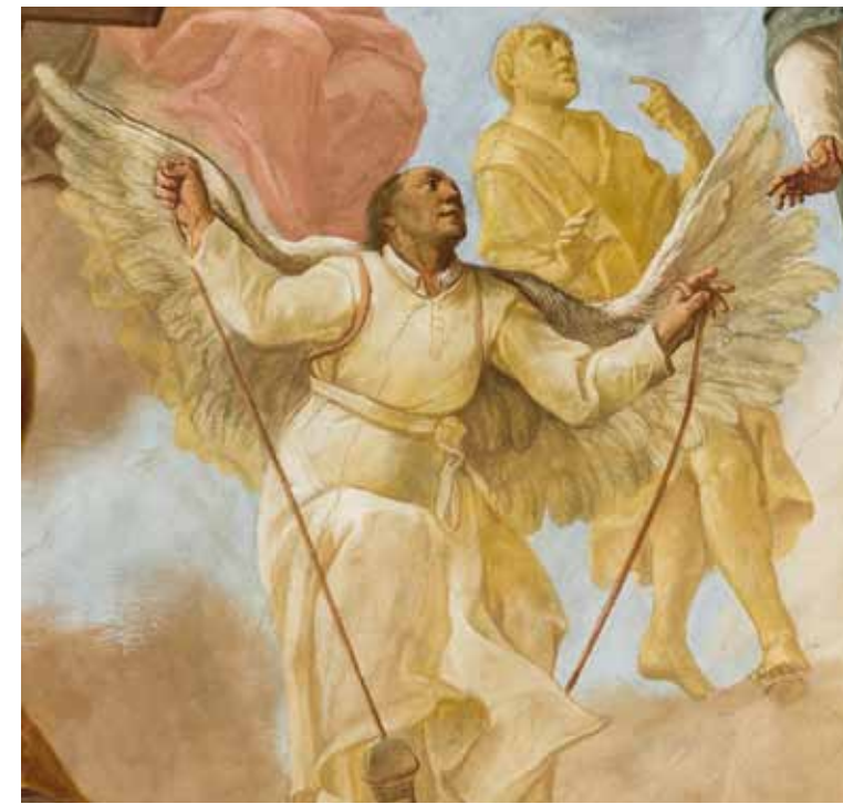
🏰 Der berühmteste Schussenrieder ist Caspar Mohr. Der Chorherr, im Deckenbild der Bibliothek, wäre fast Flugpionier geworden.

Bekanntestes Motiv des Deckenbildes ist wohl der unternehmungslustige Chorherr Caspar Mohr: Der Pater baute sich im 17. Jahrhundert einen Flugapparat mit Federn und Flügeln und wurde damit um ein Haar der Flugpionier von Oberschwaben – Generationen vor der Erfindung des Zeppelins.