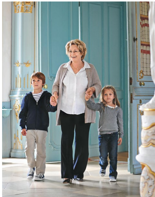
🏰 Rechts: Ein Rausch aus Formen und Farben: Der Bibliothekssaal von Kloster Schussenried ist ein Meisterwerk des Rokoko